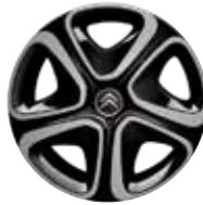
Staal 16" STEEL & STYLE 3D