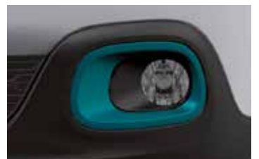
Pack Color Emerald