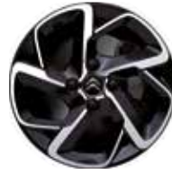
Lichtmetaal 16" Diamantée Two Tone HELLIX