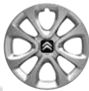
Staal 15" ARROW