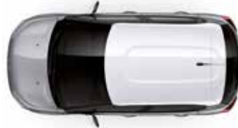
Two Tone Opal White