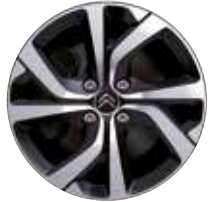
Lichtmetaal 17" Diamantée VECTOR