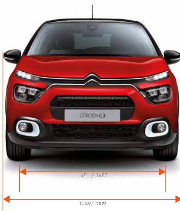
Breedte / Breedte met uitgeklapte buitenspiegels