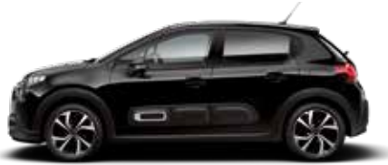
Perla Nera Black (parelmoer)