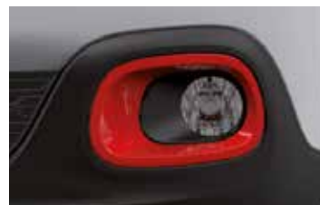
Pack Color Sport Red