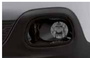
Pack Color Onyx Black