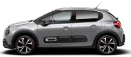
Steel Grey (metallic)