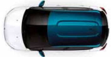
Two Tone Emerald