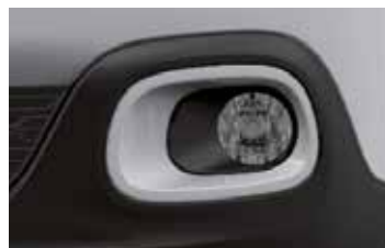
Pack Color Polar White