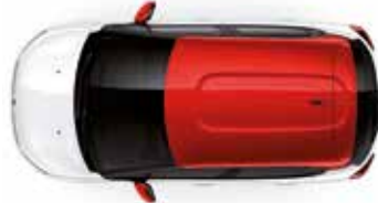
Two Tone Sport Red