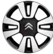
Lichtmetaal 16" Diamantée MATRIX