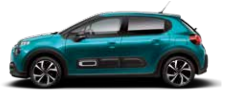
Spring Blue (parelmoer)