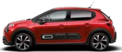
Elixir Red (parelmoer)