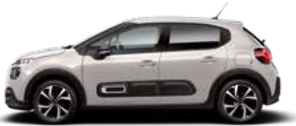
Soft Sand (parelmoer)