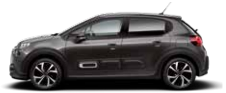
Platinum Grey (metallic)