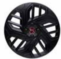
18" lichtmetalen velgen TOULOUSE