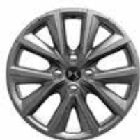
17" lichtmetalen velgen GLASGOW