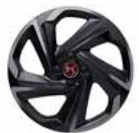
18" lichtmetalen velgen BOSTON