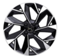
18" lichtmetalen velgen NICE