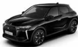
Perla Nera Black