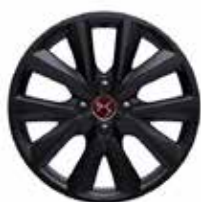
17" lichtmetalen velgen OSLO