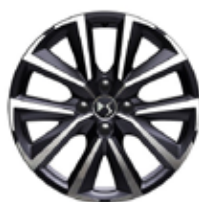
17" lichtmetalen velgen DUBLIN