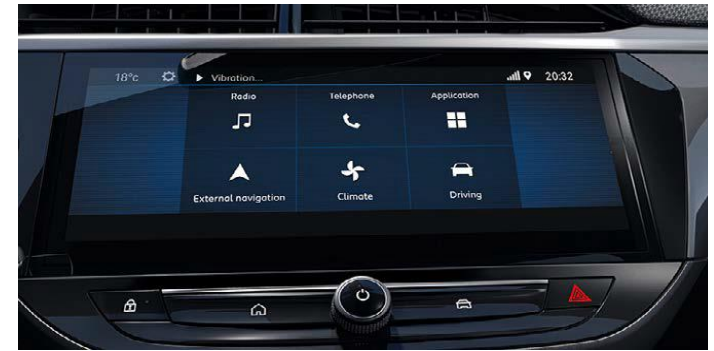
Multimedia systeem met 10" kleuren touchscreen