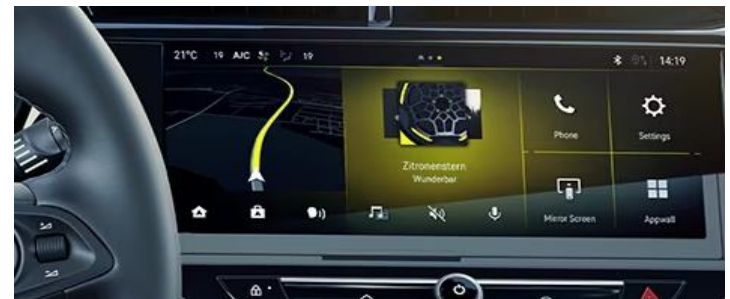
Multimedia Navi IVI met 10" kleuren touchscreen