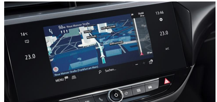
Multimedia Navi Pro met 10" kleuren touchscreen